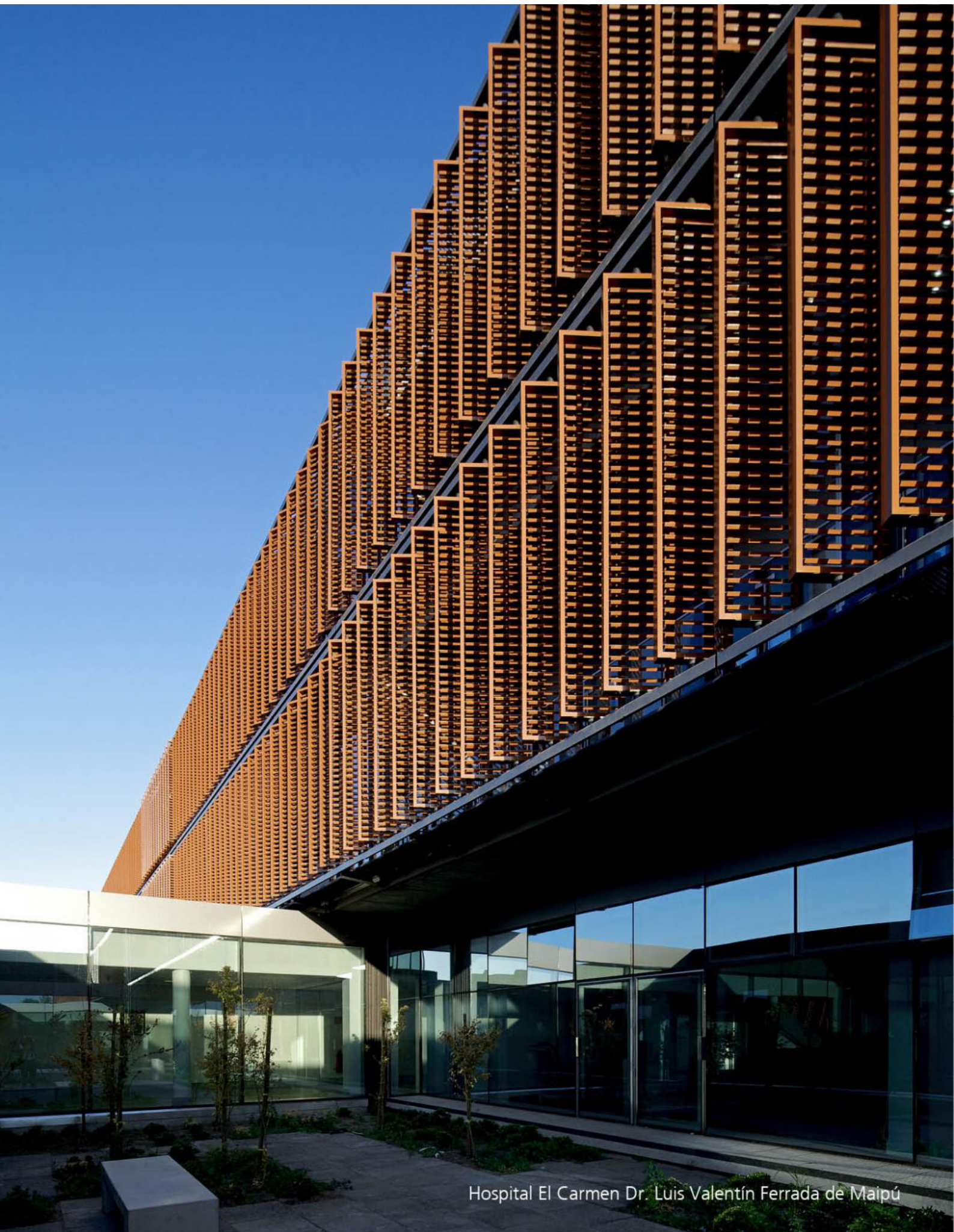
Hospital El Carmen Dr. Luis Valentín Ferrada de Maipú