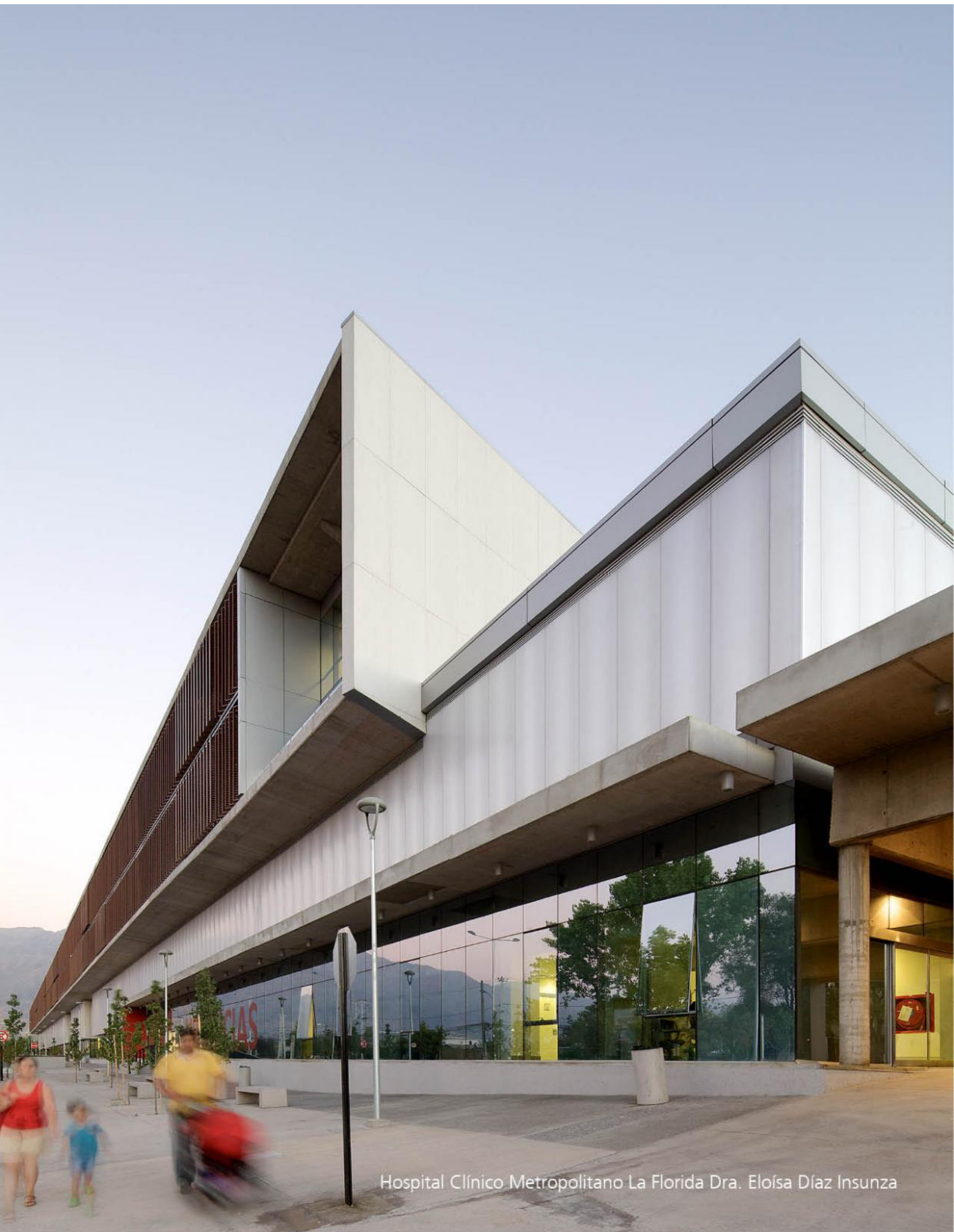
Hospital Clínico Metropolitano La Florida Dra. Eloísa Díaz Insunza