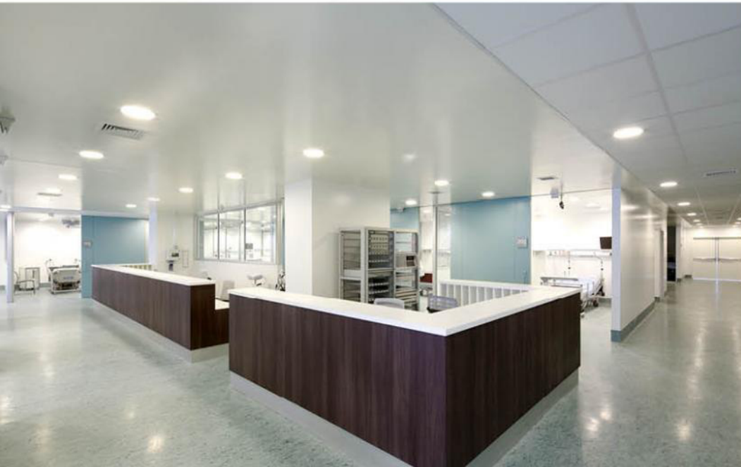
Hospital Clínico Metropolitano La Florida Dra. Eloísa Díaz Insunza