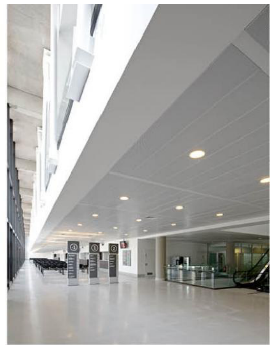
Hospital El Carmen Dr. Luis Valentín Ferrada de Maipú